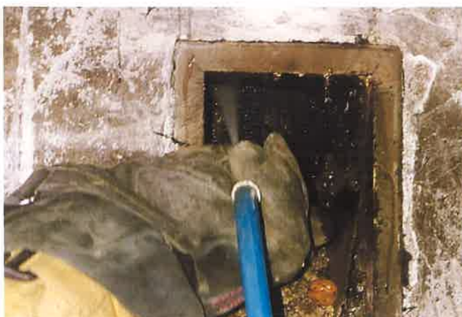
Fot. 4 Gaszenie pożaru sadzy w przewodzie kominowym (zdjęcie wykonane podczas ćwiczeń)