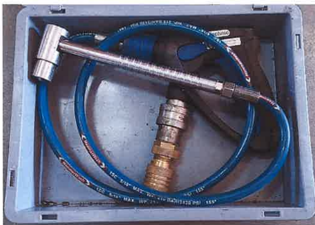
Fot. 3 Lanca kominowa FireTechnic typu FTRS Blue Fenix z dodatkowym przyłączem dedykowanym do linii szybkiego natarcia stosowanej w Jednostce Testującej (w walizce transportowej)