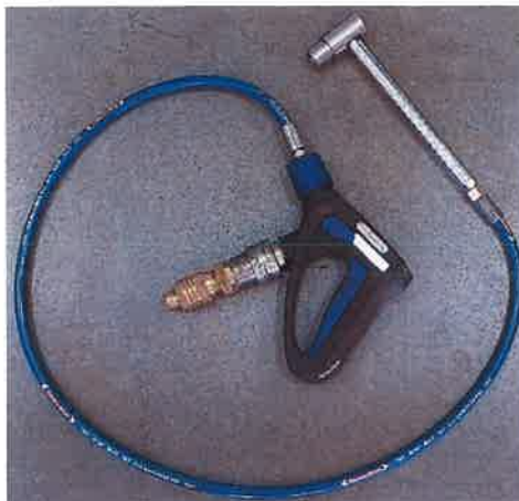
Fot. 2 Lanca kominowa FireTechnic typu FTRS Blue Fenix z dodatkowym przyłączem dedykowanym do linii szybkiego natarcia stosowanej w Jednostce Testującej